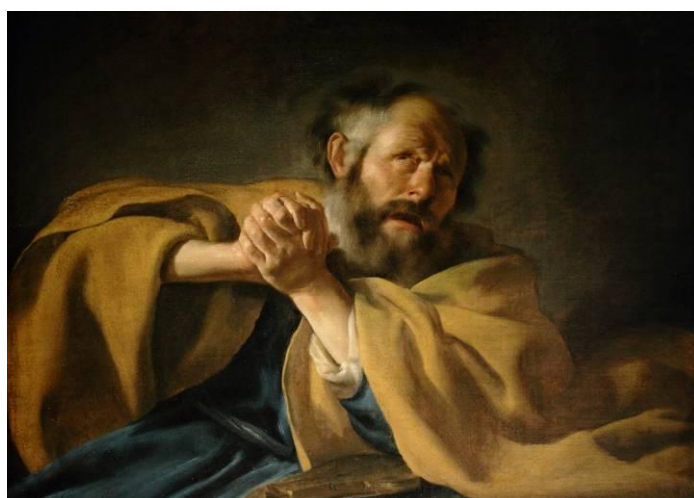
Le repentir de Pierre (Johannes Moreelse)

Dan 9/20 : Je parlais encore, je priais, je confessais mon péché et le péché de mon peuple d'Israël , et je présentais mes supplications à l'Eternel, mon Dieu, en faveur de la sainte montagne de mon Dieu ;