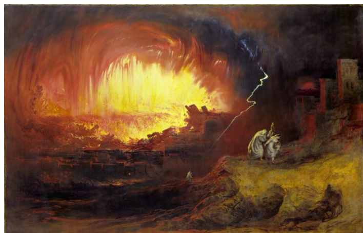
The Destruction of Sodom and Gomorrah, John Martin, 1852.

Ez 16/49 : Voici quel a été le crime de Sodome , ta sœur. Elle avait de l'orgueil, elle vivait dans l'abondance et dans une insouciance sécuritaire, elle et ses filles, et elle ne soutenait pas la main du malheureux et de l'indigent .