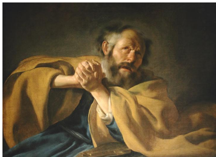
Le repentir de Saint Pierre (Johannes Moreelse, 1602-1634)

2 R 22/19 : Parce que ton coeur a été touché , parce que tu t'es humilié devant l'Eternel en entendant ce que j'ai prononcé contre ce lieu et contre ses habitants, qui seront un objet d'épouvante et de malédiction, et parce que tu as déchiré tes vêtements et que tu as pleuré devant moi, moi aussi, j'ai entendu, dit l'Eternel.