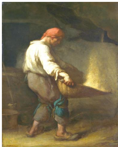
Jean François Millet, 1847-48, un vanneur, National Gallery Londres.

Luc 3/17 : Il a son van à la main; il nettoiera son aire, et il amassera le blé dans son grenier, mais il brûlera la paille dans un feu qui ne s'éteint point.