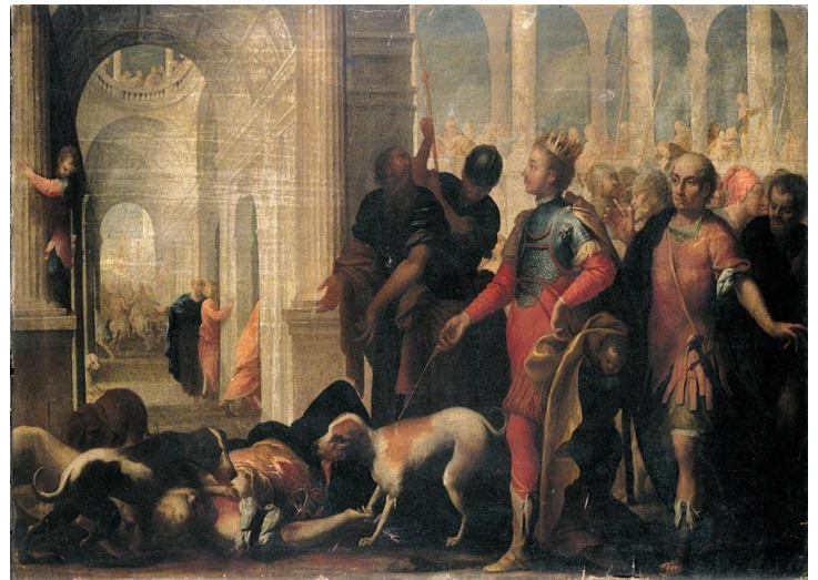
Isevel fut dévorée par les chiens ! (tableau d'Andrea Celesti, 2 e moitié de XVII e siècle)

C'est ainsi qu'il y eut une alliance par mariage, puisque Ithobaal, prêtre d'Astarté, roi de Tyr et Sidon donna sa fille Isevel (אִיִּזְבֵּל : île de fumier, אִי : île, זֵבֵל : fumier, ordure) en mariage au roi d'Israël, Achab (1 Rois 16/31). Ce fut l'occasion d'une longue période de paganisme et de souffrances en Israël et Juda.