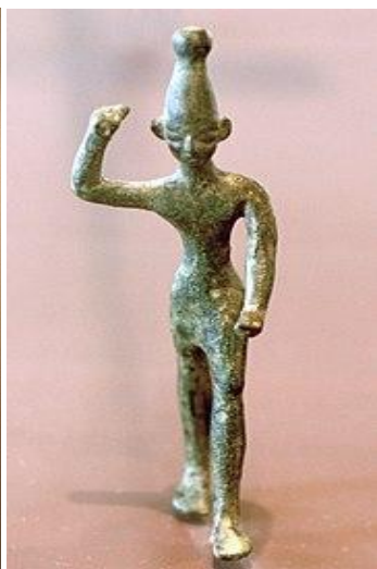
Astarté entourée d'hiboux et Baal au bras levé, tenant la foudre.