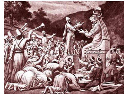
Bible Pictures with brief descriptions, Charles Foster, 1897

Tyr a aussi créé la colonie de Carthage, dans la Tunisie actuelle. Cette ville devint si puissante qu'elle faillit faire tomber l'empire romain. Son Dieu était Baal-Moloch, le monstre qui dévorait les enfants dans ses flammes. Des rois d'Israël ont ainsi fait « passer par le feu » leurs enfants à Jérusalem.