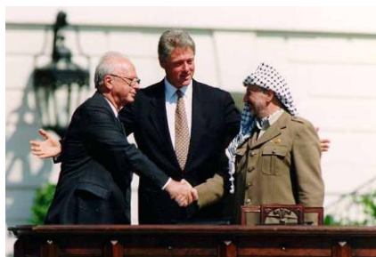
13 septembre 1993, les accords d'Oslo.

Constatons simplement que le peuple palestinien est une réplique en face du peuple d'Israël, avec les mêmes visées sur Jérusalem.