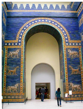
Porte d'Ishtar au musée Pergam à Berlin.

Il y a donc une comparaison intéressante entre Belschatsar et l'Antichrist de la fin des temps, ils sont tous les deux « second » dans la hiérarchie. C'est pourquoi ce jugement est si important à comprendre, car celui qui fera tomber l'Antichrist, c'est Yeshoua le second qui, après le millénium remettra le Royaume à son Père, le premier.