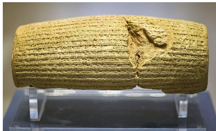
Le cylindre de Cyrus, British Museum.