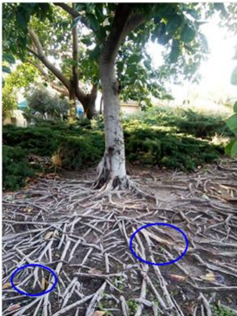
Jardins Ashkelon- Janvier 2018- 5778

Il est à remarquer que pendant les 3 premières années qui suivaient la plantation, les hébreux ne mangeaient les fruits des arbres. La raison est qu'ils devaient se rappeler que la terre appartient à Dieu et que les premiers fruits devaient lui être offerts.