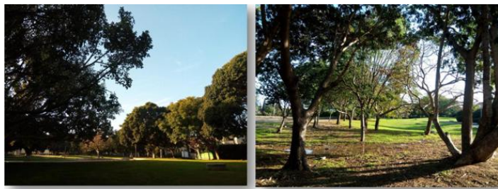
Jardins Ashkelon- Janvier 2018- 5778.