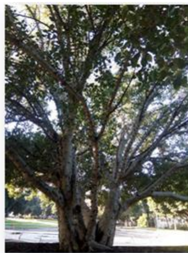
Jardins Ashkelon- Janvier 2018- 5778

Un pays sans arbre est mort. Quand les Turcs de l'empire Ottoman ont fait des voies ferrées, ils ont coupé tous les arbres d'Israël. La terre était devenue un désert avant le retour des juifs.