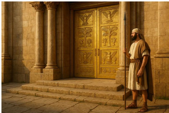
Généré par IA, Garuda_Somanna

Les premiers disciples de Yeshoua étaient appelés "Nazaréens" et non pas des "Messianiques" :