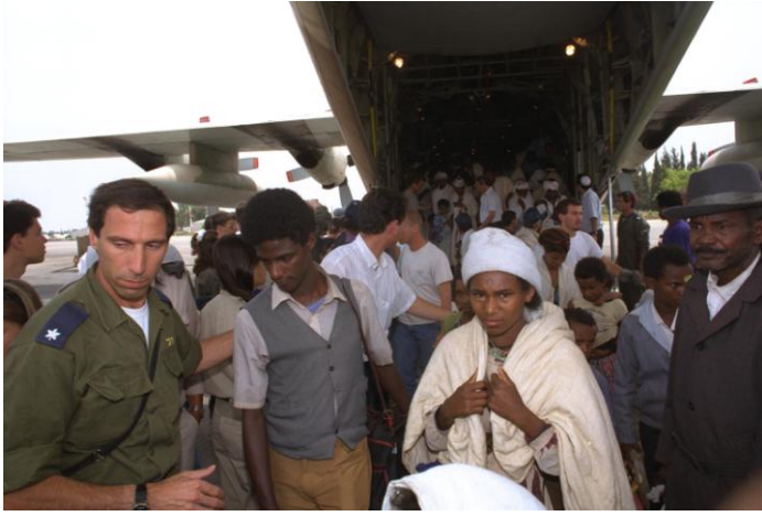
Officier de Tsahal aidant les immigrants éthiopiens à sortir hors du jet Hercule, base aérienne, opération Salomon. (Wikipédia)