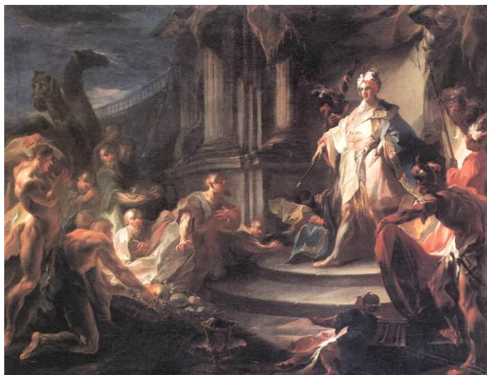
Franz Anton Maulbertsch (1724–1796), Joseph et ses frères

de lui et même s'il a pris une autre religion, sa racine est toujours vivante.