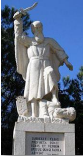
Mont Carmel, Haïfa

1 Rois 17/1 : Eliahou le Tisbite, un de ceux qui s'étaient établis en Galaad, dit à Achab: "Par le Dieu vivant, divinité d'Israël, à qui s'adressent mes hommages! il n'y aura, ces années-ci, ni pluie ni rosée, si ce n'est selon ma parole "